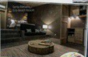
Santa Bárbara Eco-Beach Resort