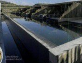
Santa Bárbara Eco-Beach Resort

no hotel. Entre Santa Bárbara, dentro uma longa caminhada na praia, que se distingue pelo seu arvoreado que dá um contraste com o azul turquesa da água.